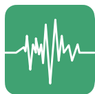
Cancellazione del rumore