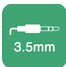
Jack cuffie da 3,5 mm