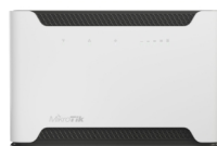
Mikrotik Chateau 1x2,5Gbps 4x1Gbps WiFi AX Cat18/5G