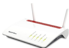
Fritz! Box 6890